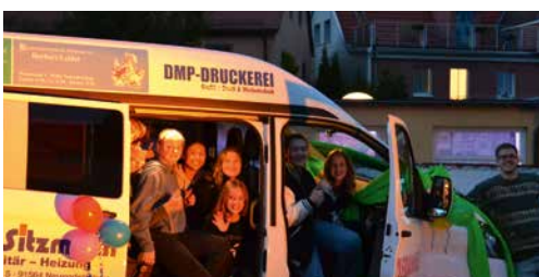
St. Nikolai, Nikolai Youth Church