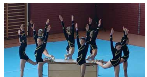
TSC Neuendettelsau, Turnen

HÖGNER BAU GMBH Baustrae 5 • 91564 Neuendettelsau