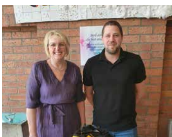
Grund- und Mittelschule Neuendettelsau