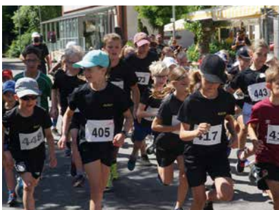
TSC Neuendettelsau, Leichtathletik