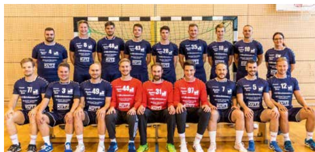
TV Heilsbronn, Abteilung Handball