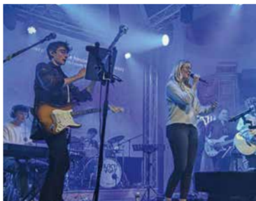
St. Nikolai, Church Night

bewusst. Im Austausch mit Vereinen, Kunstlern, Schulen und Kirchen konnten wir im Rahmen unserer Moglichkeiten dennoch etliche Aktionen unterstutzen. Hier sehen Sie einige Beispiele.