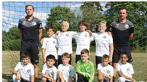
SpVgg Ansbach, Fußball U 10 Jugend