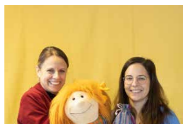
St. Nikolai, Wunderruten-Gottesdienst