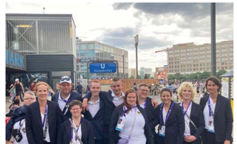
Special Olympics World Games