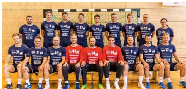
TV Heilsbronn, Handball