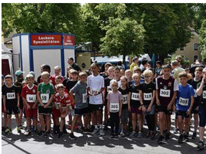
TSC Neuendettelsau, Leichtathletik