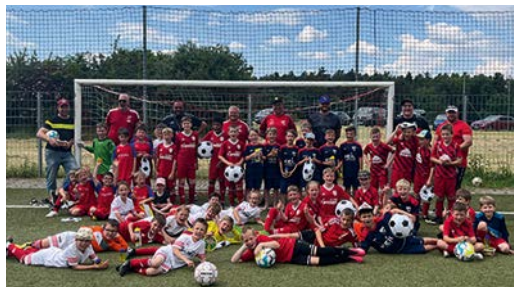
TSC Neuendettelsau, Fußball