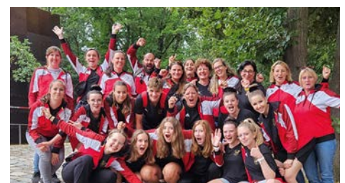
TSC Neuendettelsau, Turnen

HÖGNER BAU GMBH Baustraße 5 • 91564 Neuendettelsau