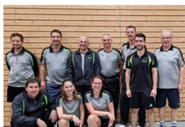
TSC Neuendettelsau, Tischtennis