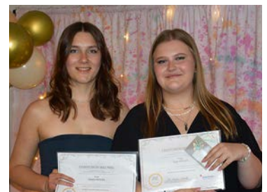
Laurentius- Fachoberschule, Abi-Preis