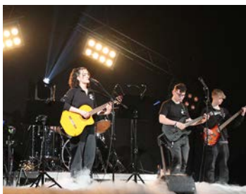
Laurentius- Realschule, Frühjahrskonzert