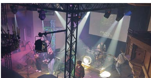
St. Nikolai, Church Night