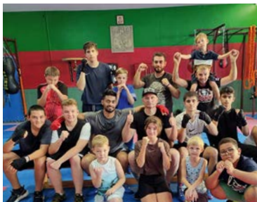
Internationales Turnier Viking Boxing Cup 2023

Möglichkeiten unterstützen wir deren Aktivitäten mit dem Einsatz von finanziellen Mitteln, Sachspenden, Know-How und persönlichem Engagement. Hier sehen Sie einige Beispiele.