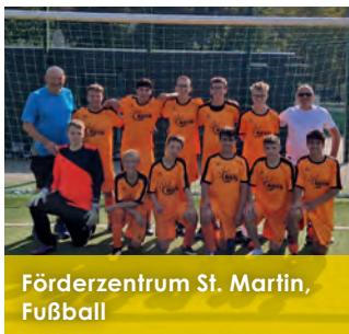
Förderzentrum St. Martin, Fußball