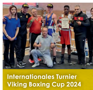
Internationales Turnier Viking Boxing Cup 2024