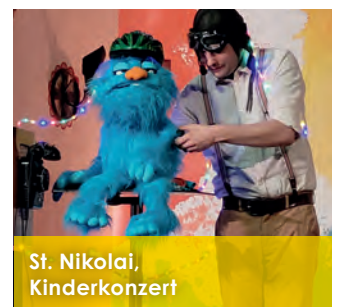
St. Nikolai, Kinderkonzert