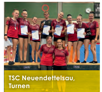
TSC Neuendettelsau, Turnen