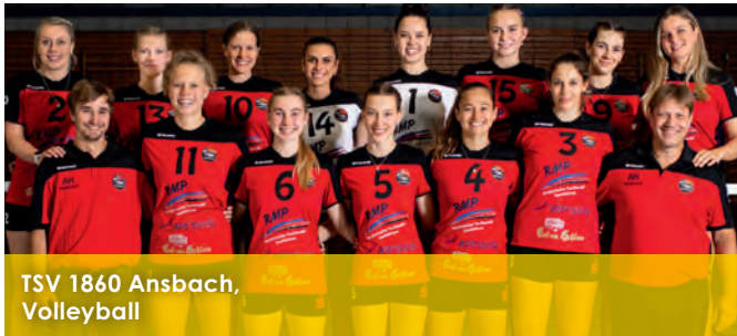
TSV 1860 Ansbach, Volleyball

dem Einsatz von finanziellen Mitteln, Sachspenden, Know-How und persönlichem Engagement. Hier sehen Sie einige Beispiele.