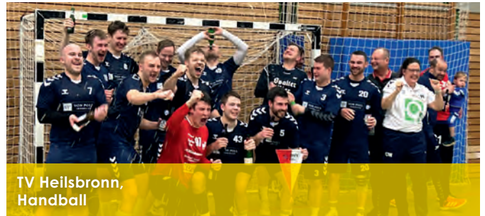
TV Heilsbronn, Handball