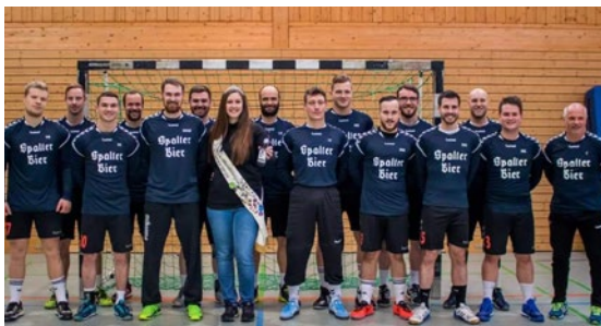
TV Heilsbronn, Abteilung Handball