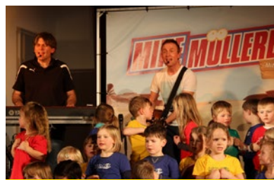
St. Nikolai, Konzert