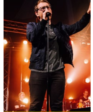
St. Nikolai, ChurchNight