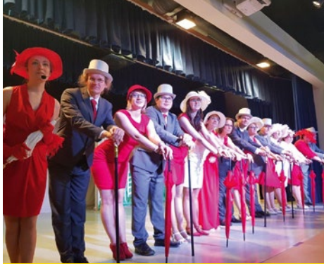
Musical Family e. V. Eckental

Als Familienunternehmen mit 126-jähriger Unternehmensgeschichte sind wir uns unserer gesellschaftlichen Verantwortung bewusst. Wir stehen daher im Austausch mit Vereinen, Verbänden, Institutionen, Schulen und Kirchen. Im Rahmen unserer Möglichkeiten unterstützen wir deren Aktivitäten mit dem Einsatz von finanziellen Mitteln, Sachspenden, Know-How und persönlichem Engagement. Hier sehen Sie einige Beispiele.