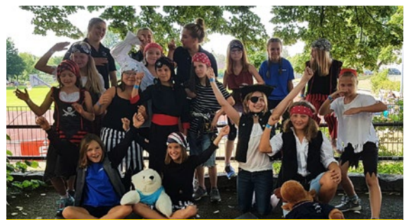
TSC Neuendettelsau, Abteilung Turnen