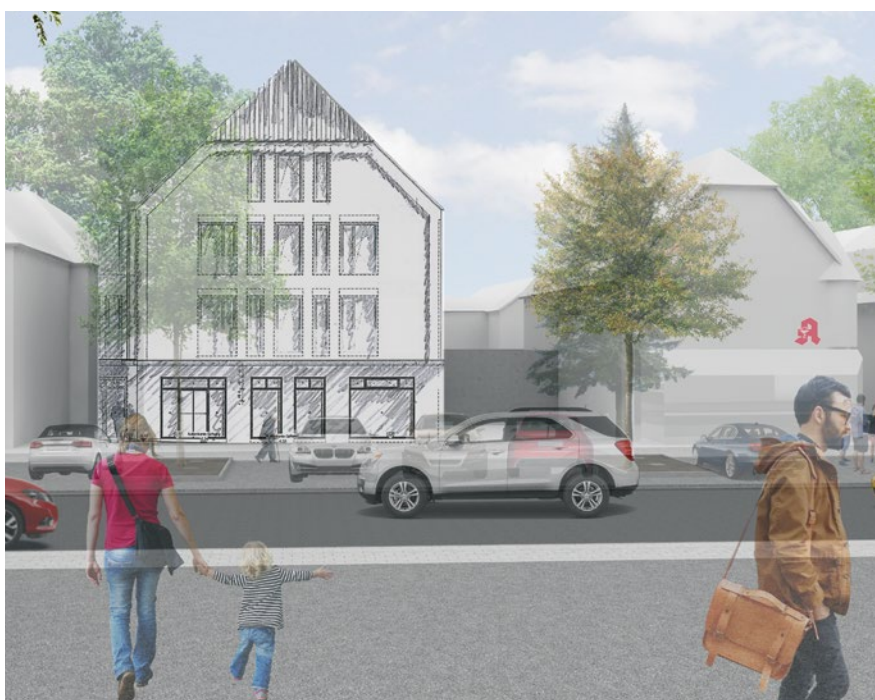
Neues, modernes und multifunktionales Gebäude in der Hauptstraße 13/15 in Neuendettelsau

Interesse geweckt? Kontaktieren Sie uns gerne für weitere Informationen zu diesem Bauprojekt.