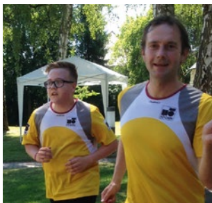
Stiftungslauf Augustana Hochschulstiftung