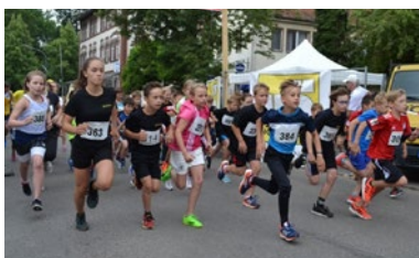
TSC Neuendettelsau, Abteilung Leichtathletik