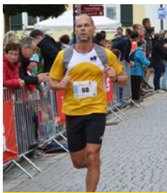
2-Städte-Lauf Merkendorf / Wolframs-Eschenbach